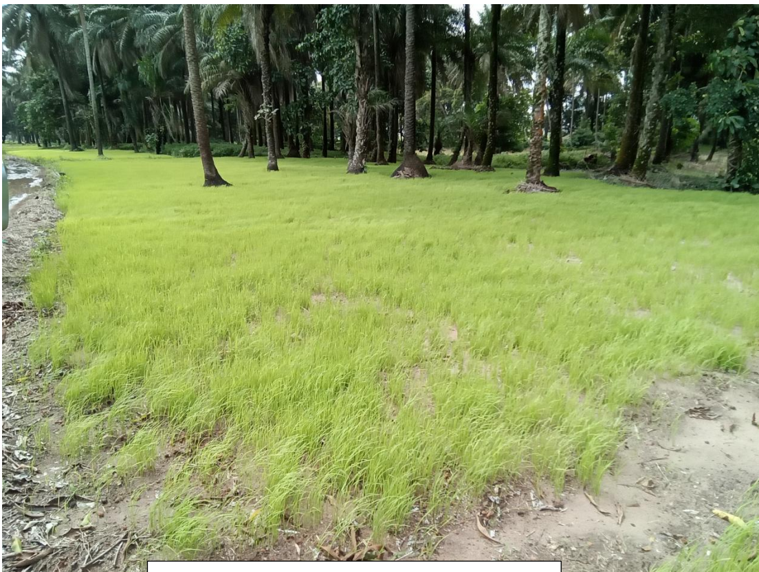
PEPINIERE DE RIZ A KOBA