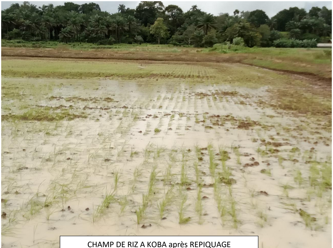
CHAMP DE RIZ A KOBA après REPIQUAGE