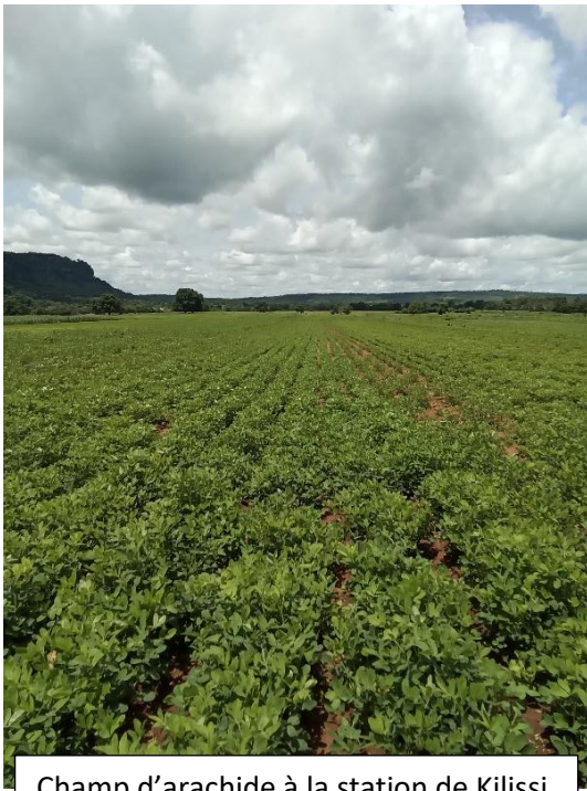
Champ d'arachide à la station de Kilissi