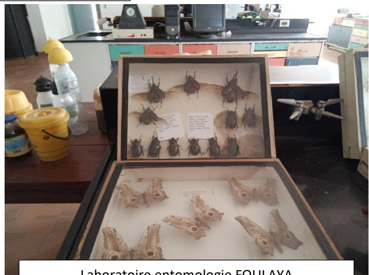
Laboratoire entomologie FOULAYA