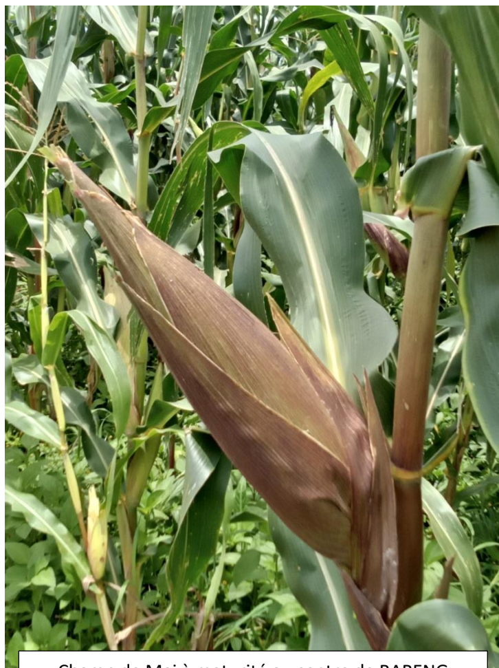
Champ de Mai à maturité au centre de BARENG