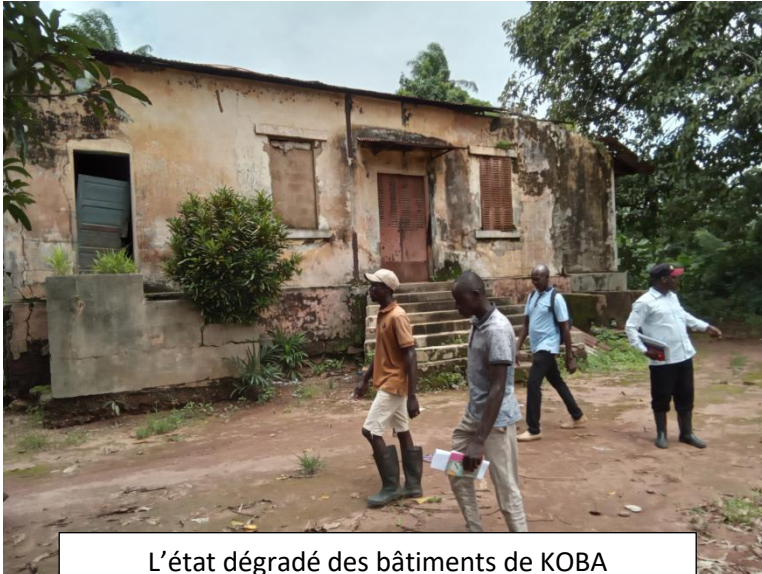
L'état dégradé des bâtiments de KOBA