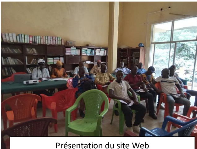
Présentation du site Web