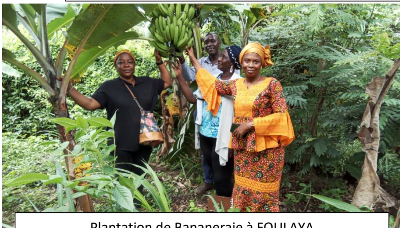
Plantation de Bananeraie à FOULAYA