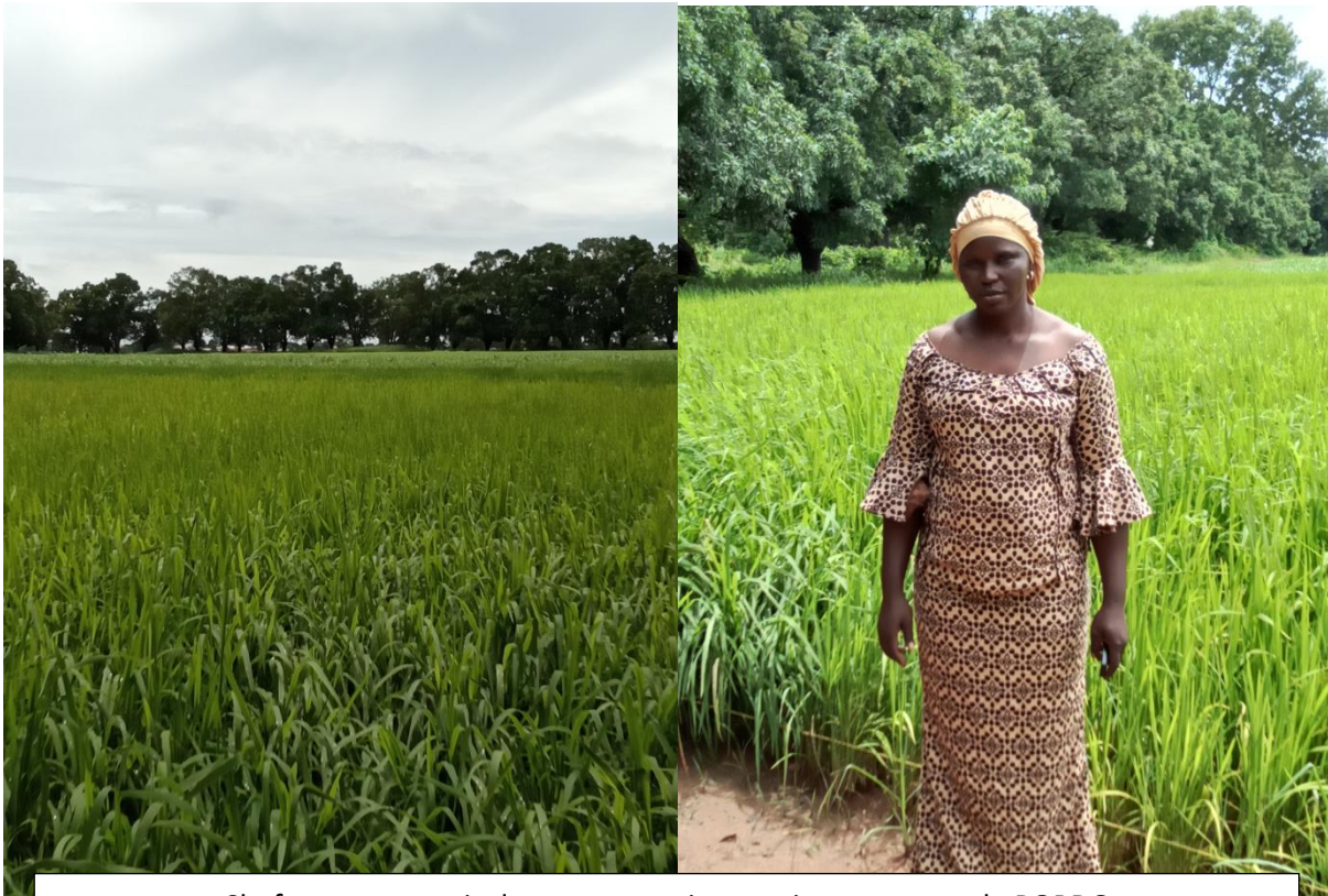
Chef programme riz devant un essai en station au centre de BORDO