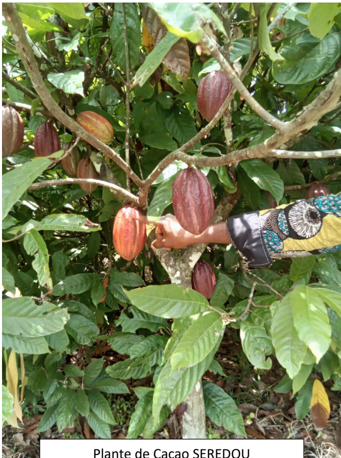
Plante de Cacao SEREDOU