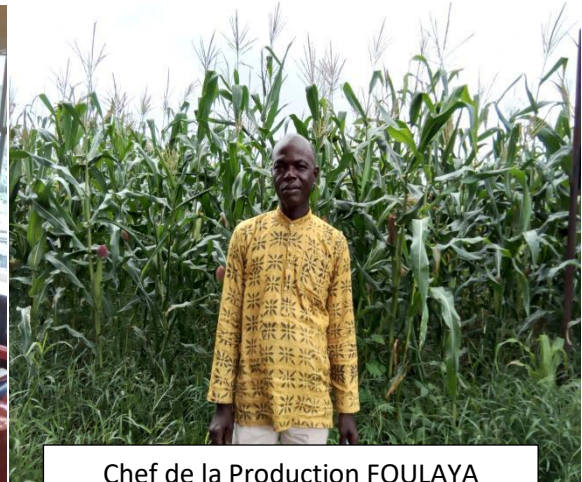
Chef de la Production FOULAYA