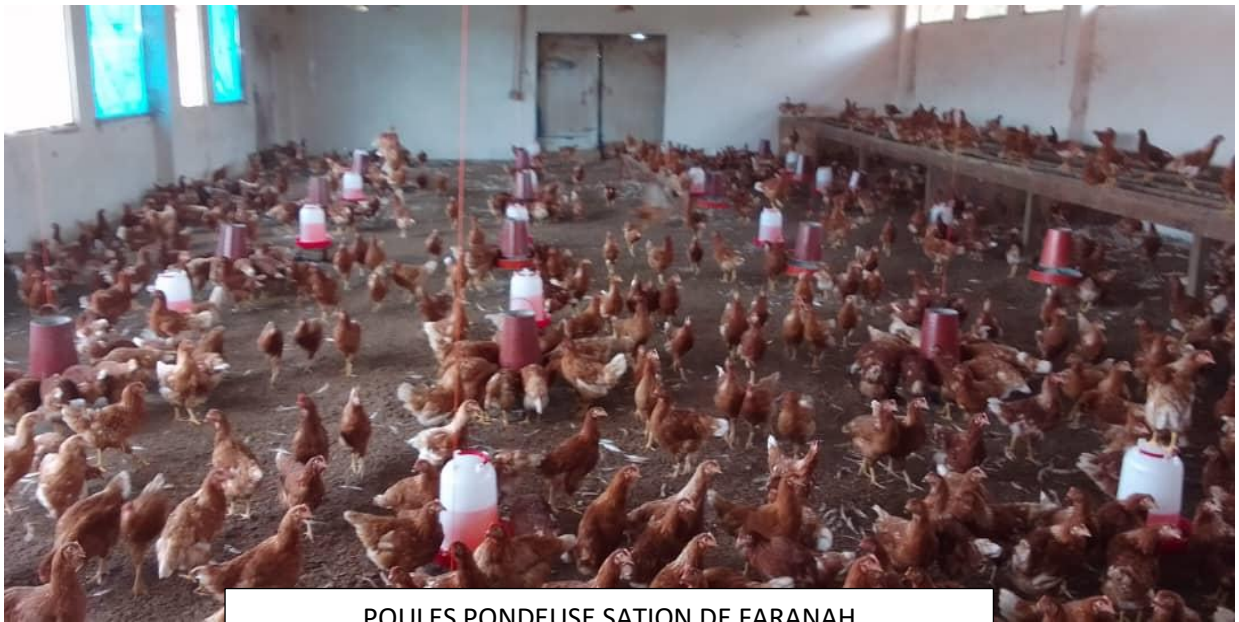
POULES PONDEUSE SATION DE FARANAH