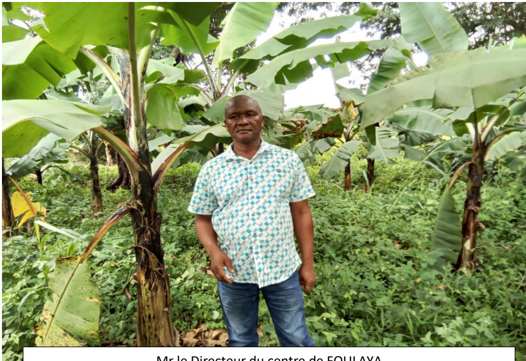
Mr le Directeur du centre de FOULAYA