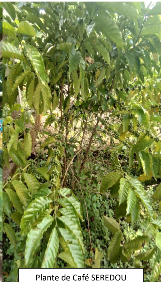
Plante de Café SEREDOU