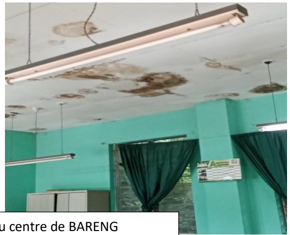
L'état dégradé des bâtiments au centre de BARENG