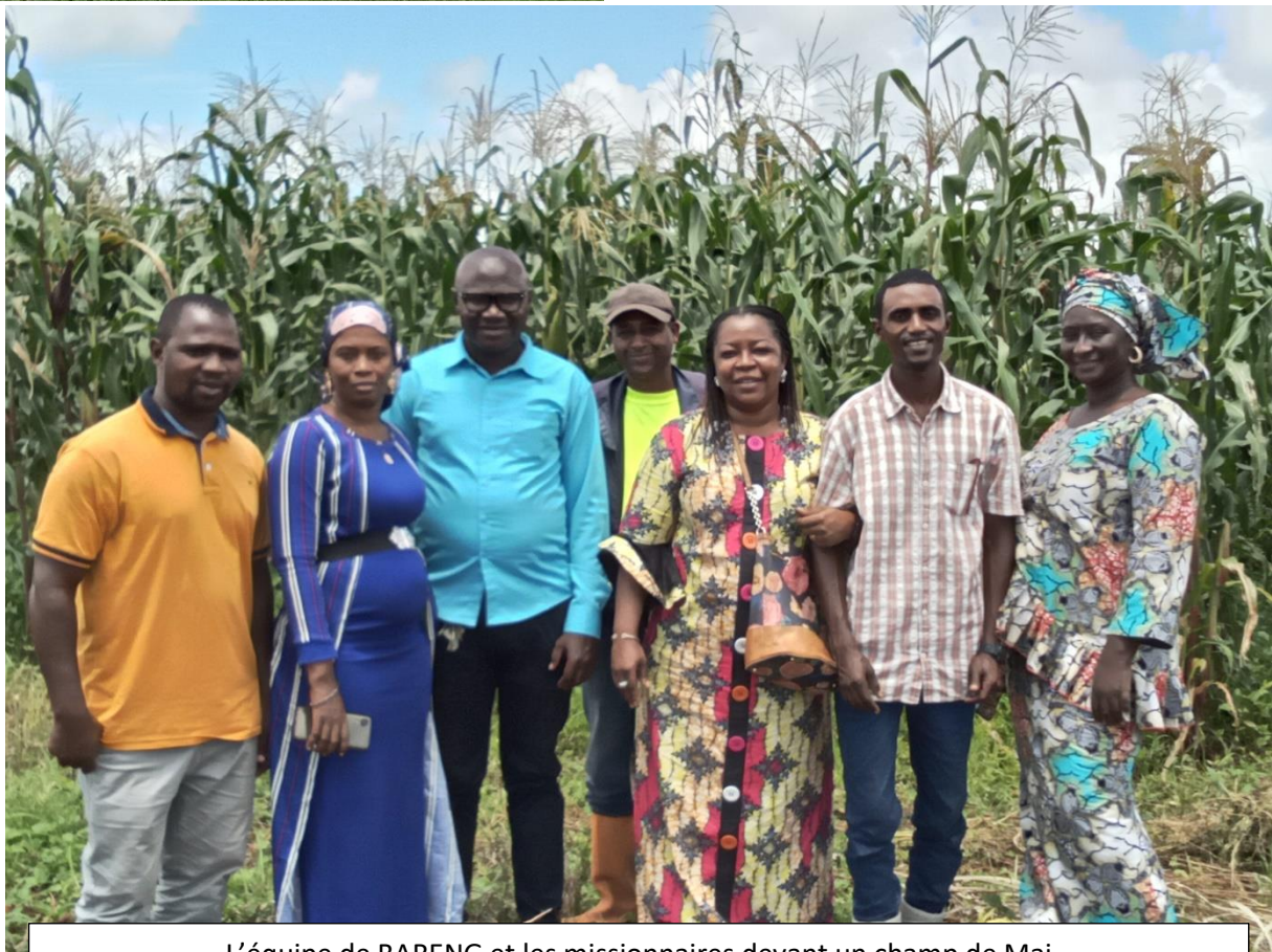
L'équipe de BARENG et les missionnaires devant un champ de Mai