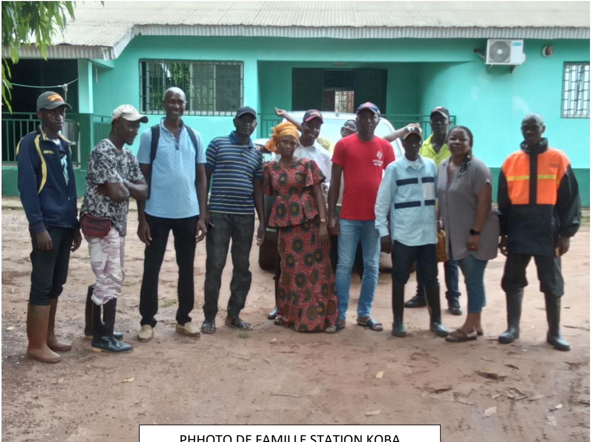
PHOTO DE FAMILLE STATION KOBA