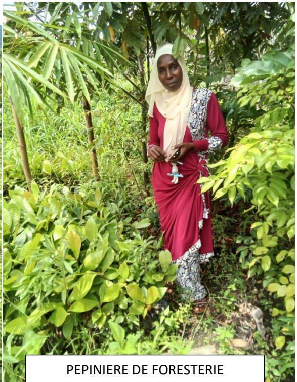
PEPINIERE DE FORESTERIE