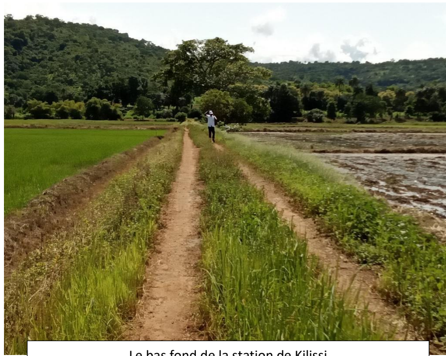
Le bas fond de la station de Kilissi