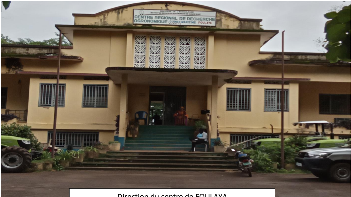
Direction du centre de FOULAYA