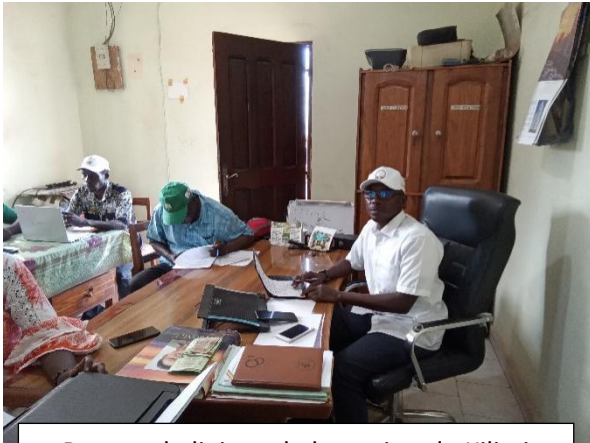
Bureau de liaison de la station de Kilissi