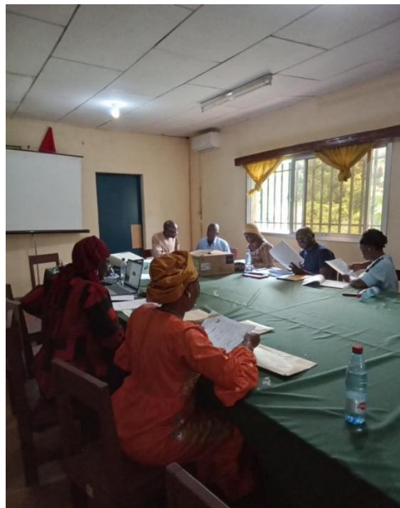
Séance de remplissage des fiches de la coopération au centre de BORDO