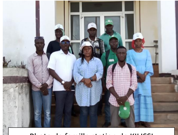
Photo de famille station de KILISSI