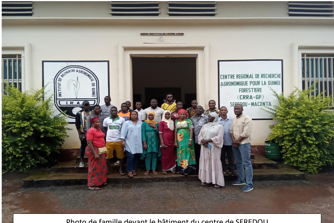
Photo de famille devant le bâtiment du centre de SEREDOU