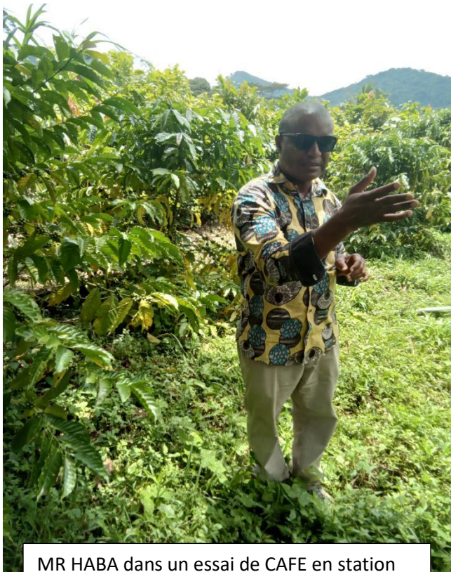
MR HABA dans un essai de CAFE en station